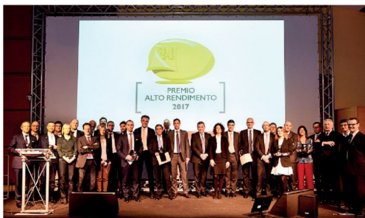
Tutti i gestori premiati nell'edizione 2017 del Premio Alto Rendimento presso la sede del Sole 24 ore in via Monte Rosa a Milano